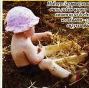
Моя донька Затарікс хотіла повторити досвід батьків і вирости в саду велику суніцю. Але це було неможливо в нашому кліматі. Але вона не здається і планує спробувати вирости велику суніцю в теплиці.

притисніть металічними прутками або целогу - ось вам і теплиця для огірків. А ось для помідорів потрібна справжня теплиця, яку краще замовити з дерева. Тоді легко буде закріплювати півку теплицером.