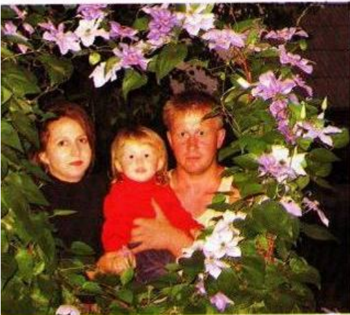
Доброго здоров'я всім читачам "Сільськогосподарського вісника"!

З повагою, та низьким укліном звертаю до вас, любі мої дописувачі. Після виходу моєї статті у четвертому номері "СВ" за 2008 рік, під назвою "Ищем, перевіряємо, порівнюємо..." на нас налетів справжній шквал листів, дзвінків, багато хто приїздив з інших міст, області. В перший день, по обіді, коли син приніс мені телефон (працюючі на садибі я ніколи його із собою не носила), щоб відповісти на дзвінок - жіночка з Києва раділа, що до вибору сортів суніць для їхньої місцевості. Після розмови я перебувала в паничому настрої, радла таму, що моя публікація привернула увагу, і люди також цікавляться тим, чим ми живемо. Та коли після розмови на екрані телефону висвітлювалося 95 неприйнятних дзвінків, я просто не повірила своїм очам. "Це якась помилка!" - подумала я. Та одразу пролунав дзвінок, потім ще і ще - вони остаточно розвіяли мої сумніви. Я стала посеред городу з сапачкою в одній руці, з телефоном в іншій - робітник вже з мене був нікудишній. І це був тільки початок.