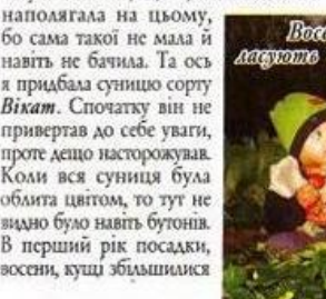
Восени діти люблять Селесо

Дуже часто задають питання: чи є "безвуса" суніця? До недавнього часу я вважала, що є, але ніколи не